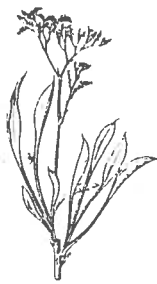
Statice pseudolimonium ou Limonium vulgare Lilas de mer ou Saladelle

Cette plante vivace à fleurs de la famille des Plombaginacées, qui pousse dans les mollières au niveau du Schorre, à proximité des digues de renclôtures, n'est recouverte que lorsque les marées hautes de vives eaux se produisent, et de ce fait elle est facilement accessible.