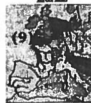
Aire de répartition marine

A l'inverse il y a ceux qui croissent dans les eaux saumâtres des bras morts de rivières et des marais intérieurs et qui une fois leur croissance terminée rejoignent les mers en redescendant