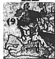
Aire de répartition marine

A l'inverse il y a ceux qui croissent dans les eaux saumâtres des bras morts de rivières et des marais intérieurs et qui une fois leur croissance terminée rejoignent les mers en redescendant