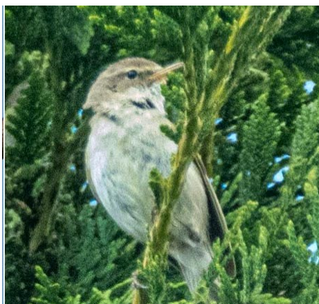
Photo 1 : Pouillots fitis Phylloscopus trochilus près d'Abbeville (Somme) le 27 juin 2024 : ce dernier avait un chant atypique, comprenant des motifs de celui du Pouillot véloce ( P. collybita ).

peu contrasté dans ses couleurs, sans détails de plumages particuliers. Mon téléphone me permet immédiatement d'en faire un enregistrement audio.