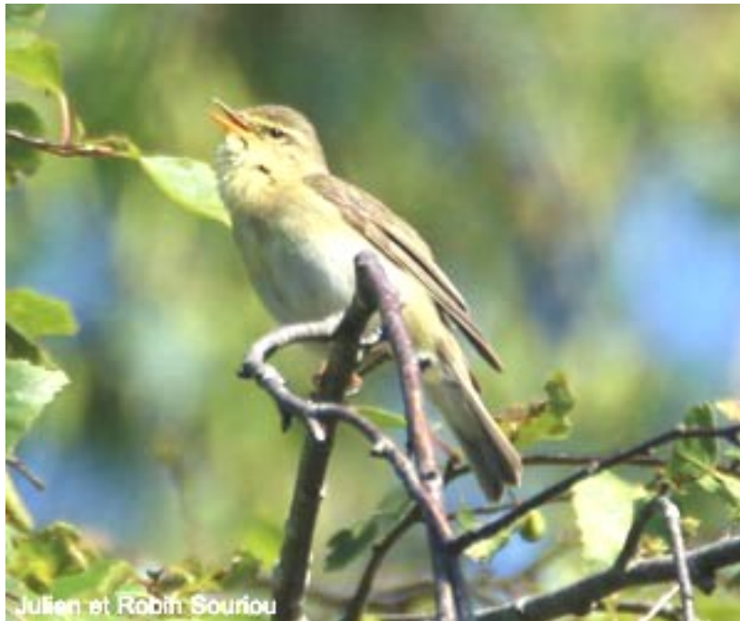
Photo 4 : Pouillot fitis ( Phylloscopus trochilus ) au chant aberrant Hardanges-en-Mayenne (Mayenne) le 5 juin 2024.