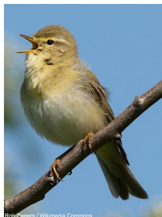
Photo 2 : Pouillot fitis Phylloscopus trochilus aux Pays-Bas en avril 2014.