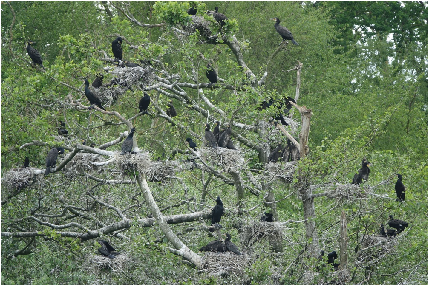
photo 1 : Marais d'Arry, site de nidification et dortoir hivernal.

Bilan départemental : 957 oiseaux regroupés en 10 dortoirs.