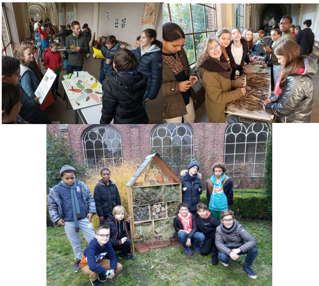
Découverte et accueil des insectes au sein du Lycée Sainte Famille, à Amiens

Au cours l'année 2019, le Pôle Découverte Nature et Environnement a conduit ou coordonné des interventions auprès de 8 structures accueillant du jeune public (7 en 2018) : 8 animations ont sensibilisé 577 jeunes à la nature et sa protection en Picardie (142 en 2018).