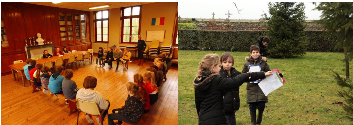
Intervention sur le site de l'AME pour les élèves de Mers-les-Bains, conseil des enfants pour les élèves de l'ATE du RPI du Mont Faÿ et état des lieux de la biodiversité pour les élèves de l'ATE de Maignelay-Montigny