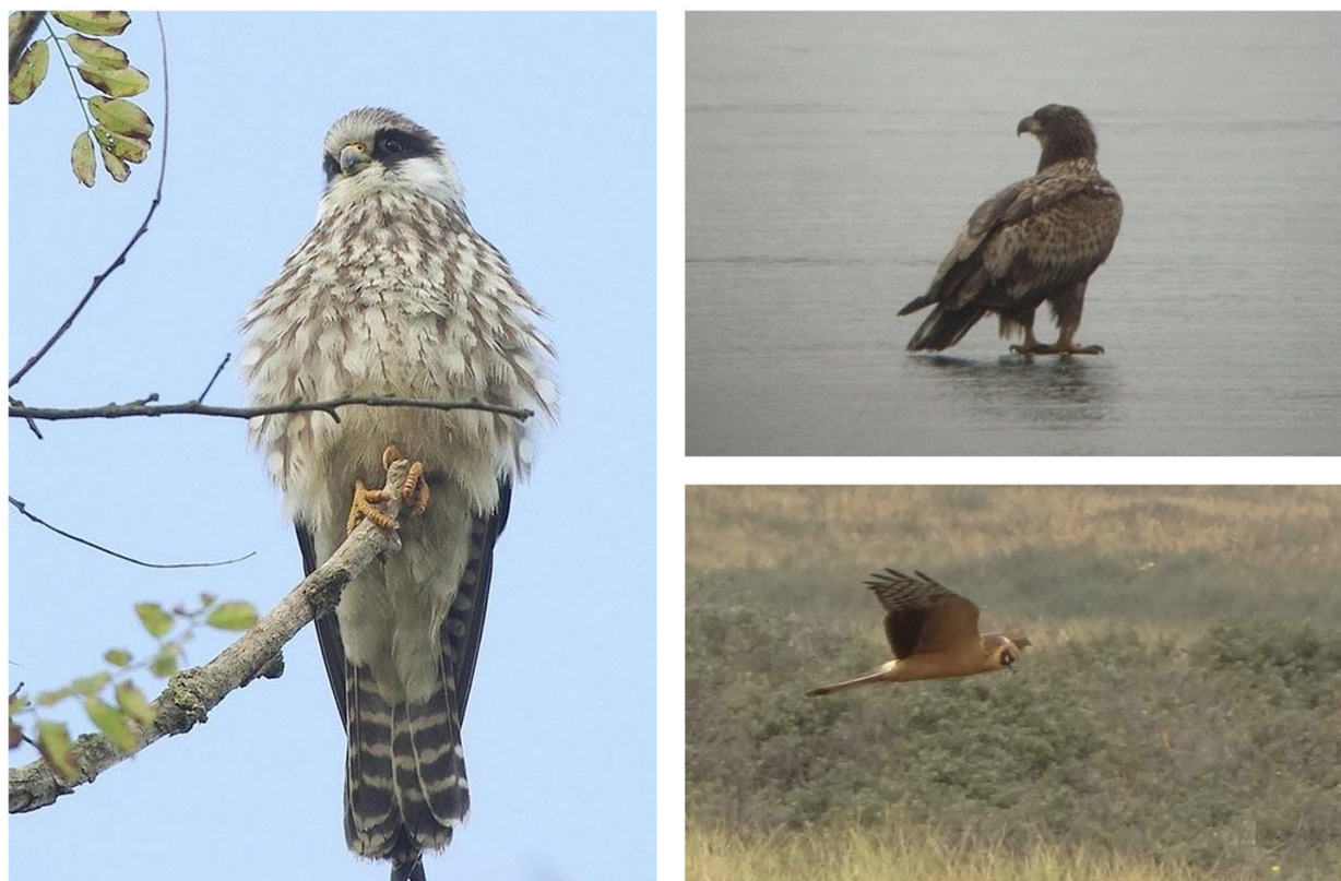
FIGURE 5 – A gauche : Faucon kobez - Brassoir-60 - octobre 2013 ; en haut à droite : Pygargue à queue blanche - Viry-Nouereuil-02 - février 2012 ; en bas à droite : Busard pâle - Baie de Somme-80 - septembre 2013