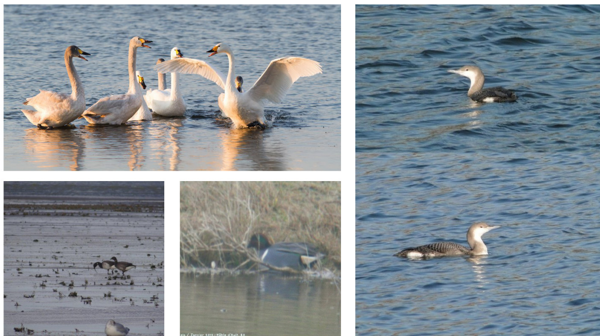
FIGURE 4 – En haut à gauche : Cygnes de Bewick - Parc du Marquenterre-80 - février 2013 ; à droite : Plongeon arctique - Monampteuil-02 - décembre 2013 ; en bas première à gauche : Bernache cravant à ventre pâle - Baie d'Authie-80 - novembre 2012 ; en bas seconde au milieu : Sarcelle à ailes vertes - Hâble d'Ault-80 - janvier 2012