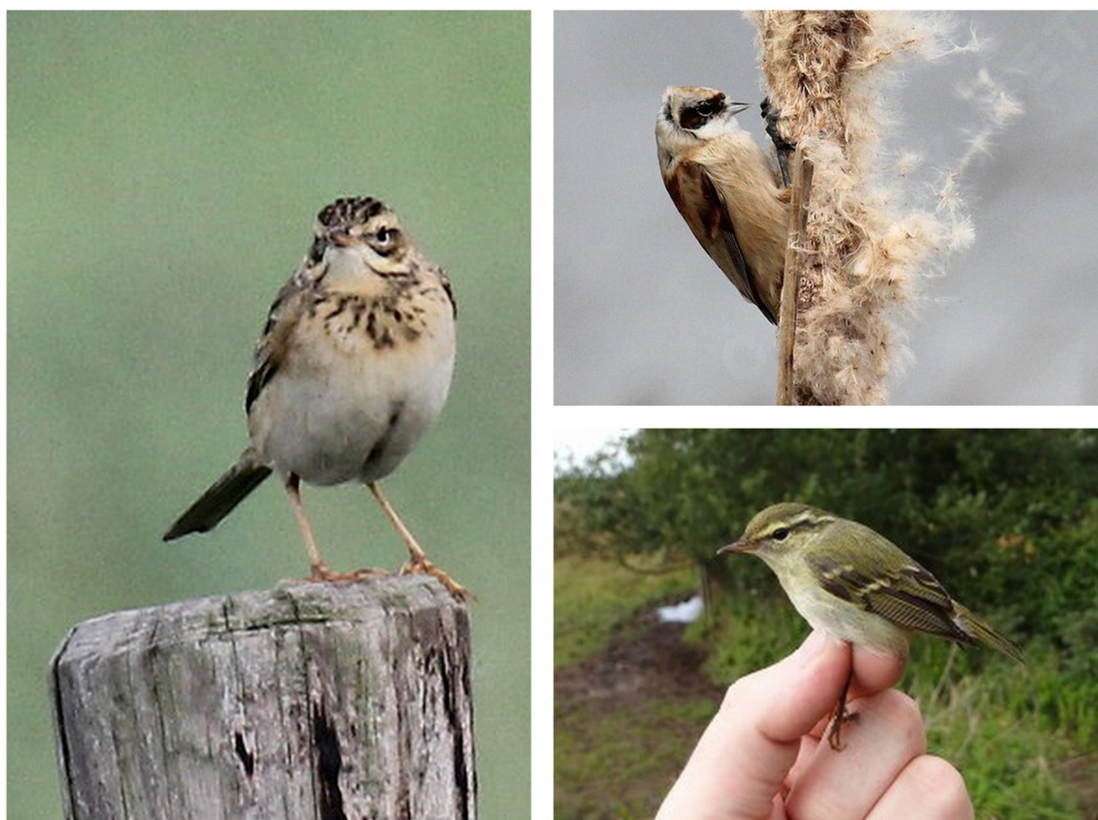
FIGURE 8 – A gauche : Pipit de Richard - Cayeux-sur-mer-80 - novembre 2013 - photo P. Bécue ; en haut à droite : Rémiz penduline - Le Crotoy-80 - novembre 2013 - photo P. Bécue ; en bas à droite : Pouillot à grands sourcils - Parc du Marquenterre-80 - septembre 2012 - photo A. Leprêtre