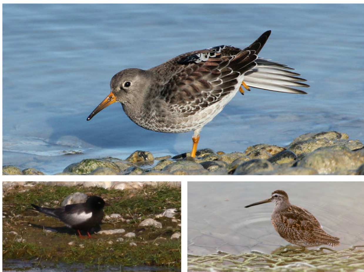
FIGURE 6 – En haut : Bécasseau violet - Le Hourdel-80 - novembre 2012 - photo P. Tillier ; en bas à gauche : Guifette leucoptère - Cayeux-sur-mer-80 - mai 2013 - photo A. Guillo ; en bas à droite : Bécassin à bec court - Le Crotoy-80 - novembre 2012 - photo P. Dufour