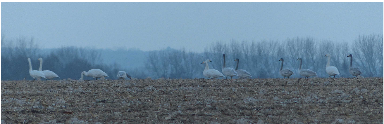
FIGURE 3 – Cygnes de Bewick - Ponthoile-80 - février 2013

Pour optimiser la place, un certain nombre d'abréviations ont été utilisées ci-après : m - mâle ; f - femelle ; ad - adulte ; AX - oiseau de X-ième année civile ; imm - immature.