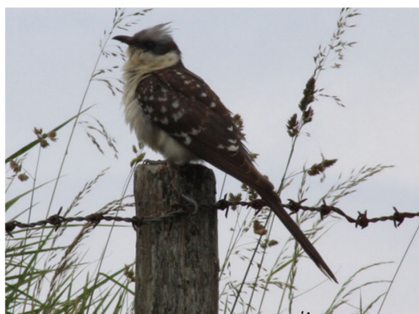
FIGURE 7 – En haut à gauche : Labbe à longue queue - Vecquemont-80 - septembre 2012 ; en bas à gauche : Goéland pontique - Boismont-80 - janvier 2013 ; en haut à droite : Goéland à bec cerclé - Cayeux-sur-mer-80 - décembre 2012 ; en bas à droite : Cocou geai - Fort-Mahon-80 - juin 2012