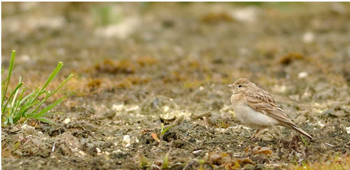
Alouette calandrelle - Renansart-02 - mai 2013