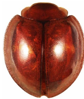
Chilocorus bipustulatus forme iranensis