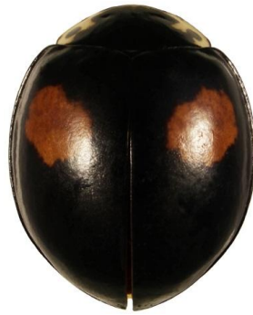
Olla v-nigrum (forme foncée)