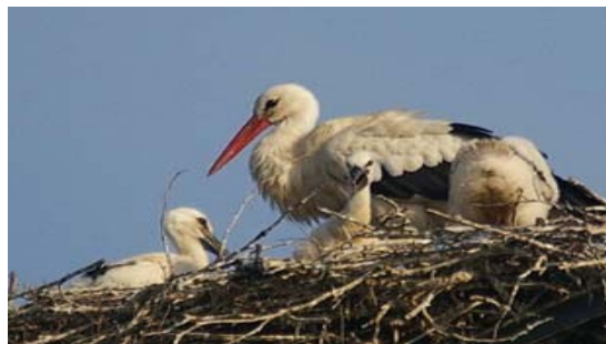
Adulte et cigogneau au nid

18 juin Les cigogneau commencent à rester debout et fientent à l'extérieur du nid. Une Taupe est avalée directement après avoir été régurgitée par un des parents.