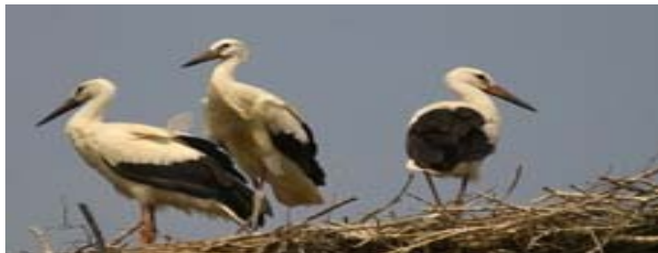
Les cigogneaux avant leur envol

L'expansion régionale de cette espèce continue puisqu'un autre couple était installé en 2006 à Malzy (02) en haute vallée de l'Oise et a donné deux jeunes à l'envol (C. ROUSSEAU & al., com. pers.)