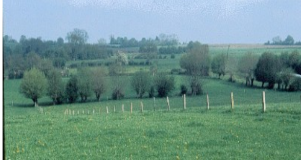
(Bocage brayon près de Senantes)

Cette population a bien été suivie par Sophie PETIT, grâce à une prospection systématique. Ce sont au total 36 mâles chanteurs qui ont été contactés sur les secteurs allant d'Auneuil à Allonne. C'est la fin du secteur bocager du Bray. Malheureusement la déviation de la N31 au sud de Beauvais passe en plein dans ce territoire, annonçant des jours funestes pour l'espèce très impactée par la mortalité routière.