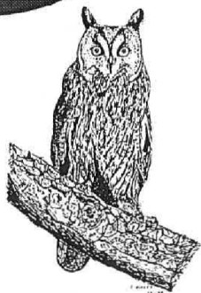
Hibou moyen-duc Asio otus (Dessin de Florent VIOLET)

Vincent TERNOIS 17 rue de Saucourt 80390 Nibas