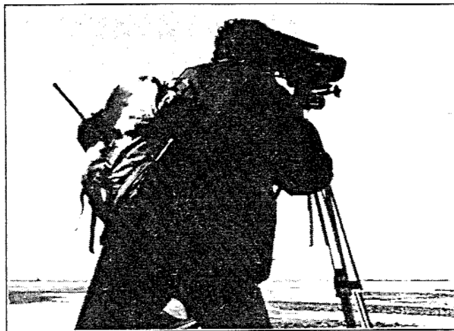
Après, en Baie de Somme