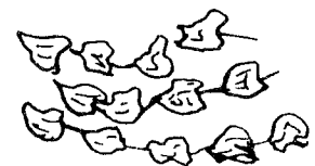
Moquettes d'hiver rigoureux