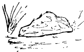
Bouse début de printemps