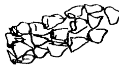
Moquettes d'hiver doux