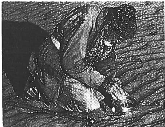
Le «blason» de Théodore Monod