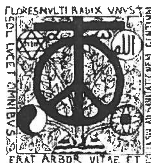
Le «blason» de Théodore Monod