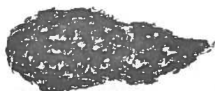
FAUCON CRECERELLE ( Falco tinnunculus )