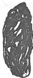
HIBOU MOYEN-DUC ( Asio otus )