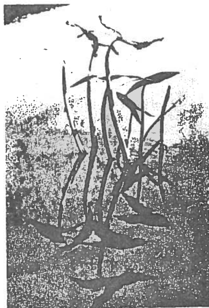
Aisne : une sagittaire

• Comité de défense des marais d'Isle de Saint-Quentin. c/o Serge Boutinot, Rouvray. 02100 Saint-Quentin. Tél. (23) 62.31.37