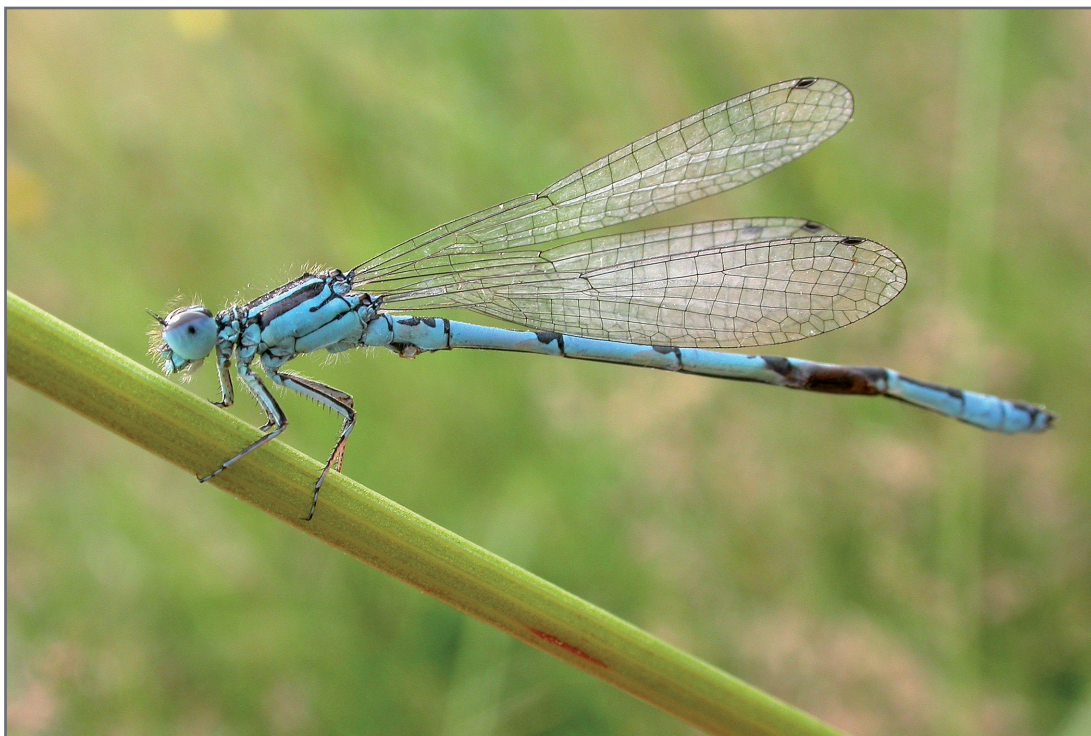
Photo : Agrion de mercure Cœnagrion mercuriale

Ces facteurs font l'objet d'une présentation globale, comprenant une description puis un bilan par station, visant à aboutir à des prescriptions pertinentes. En complément, nous avons déterminé les modalités d'un suivi des populations de l'Agrion de Mercure en Picardie.