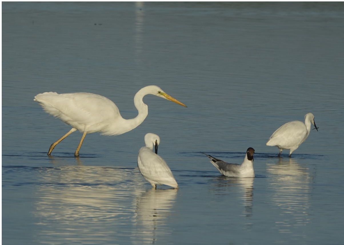
Photo 1 : Grande aigrette en action de pêche, accompagnée de deux Aigrettes garzettes et d'une Mouette rieuse en baie d'Authie.