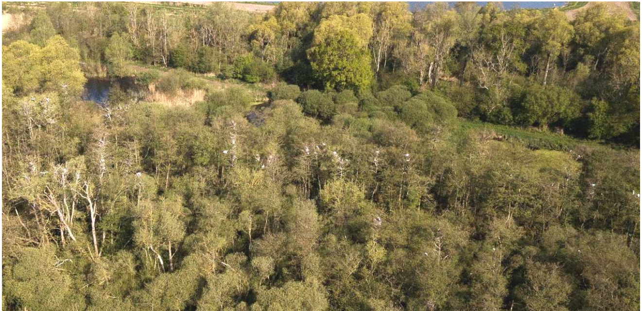
Photo 1 : vue aérienne partielle de la colonie de Grands Echassiers de la basse vallée d'Authie.

Il n'y a guère que les Hérons cendrés qui puissent être recensés de façon convenable de notre spot d'observation grâce à leur installation précoce.