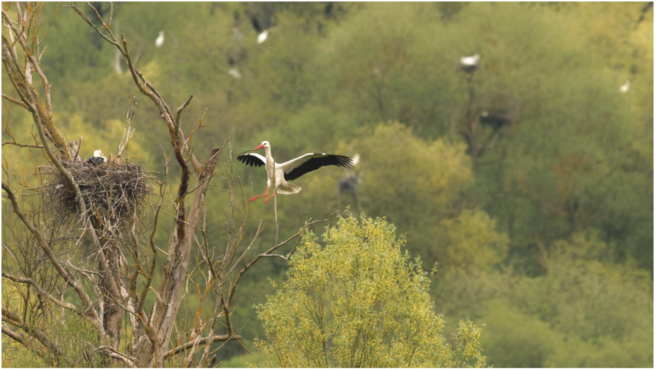
Photo 5 : Cigogne apportant une branche au nid.

Il convient cependant de rester prudent quant au nombre de reproducteurs effectifs, le suivi n'ayant pas été prolongé au-delà du mois d'avril et des dérangements éventuels sur le site ayant pu altérer la réussite de la reproduction.