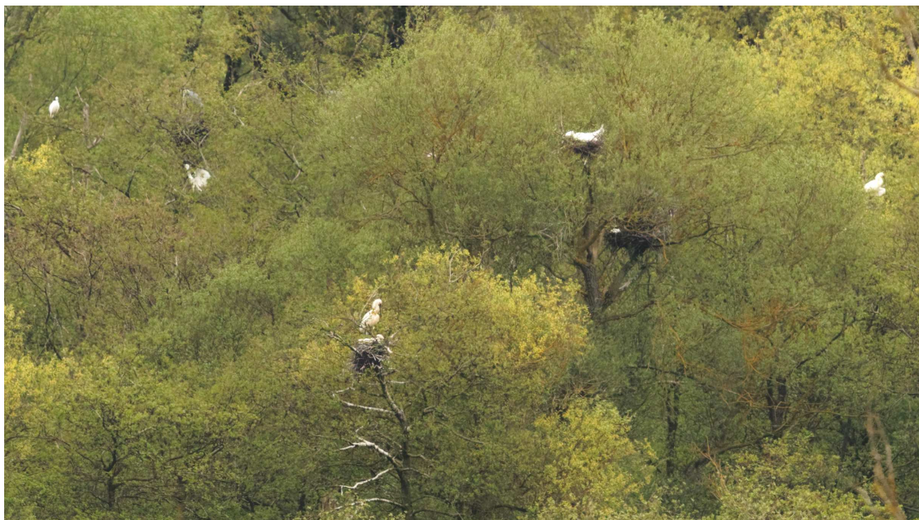
Photo 2 : avec un fort grossissement, l'observation à partir du sol permet de repérer et d'identifier une petite partie des oiseaux nicheurs (ici, au centre gauche de l'image, un nid occupé par deux Spatules blanches, et au centre droit, plus haut, une Grande Aigrette en position d'incubation).

Pour ces raisons, nous avons cherché en 2019 à recourir à un drone afin d'améliorer la qualité du recensement.