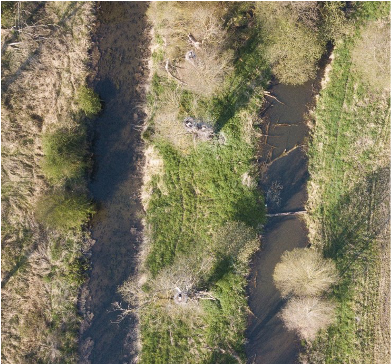
Photo 4 : extrait d'une photographie montrant l'aspect typique contrasté blanc/noir des Cigognes blanches occupant leurs nids et la proximité rapprochée de deux nids (empêchant la visibilité d'un des deux nids du point de vue terrestre utilisable).

Globalement, nous souhaitons mettre en avant les principales conclusions suivantes :