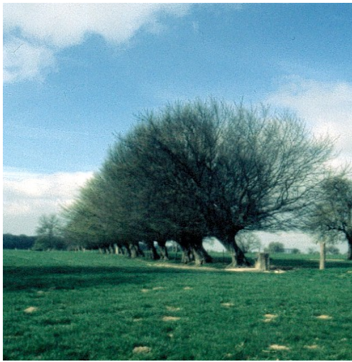
(Haie coupe-vent au Coudray-St-Germer)