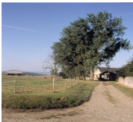
(Biotope caractéristique dans le Valois)