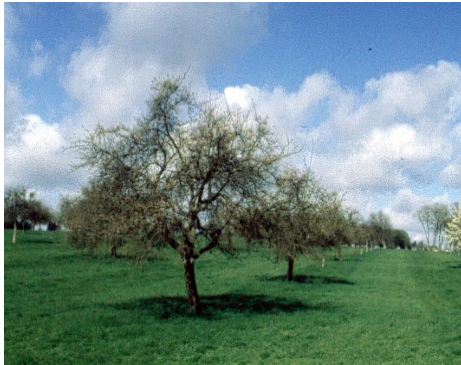
(Verger traditionnel de haute tige en Picardie verte)

Il serait d'ailleurs intéressant de suivre ce secteur pilote en Picardie en effectuant un suivi des Chevêches remises en liberté ; cela pourrait nous créer une sorte d'observatoire.