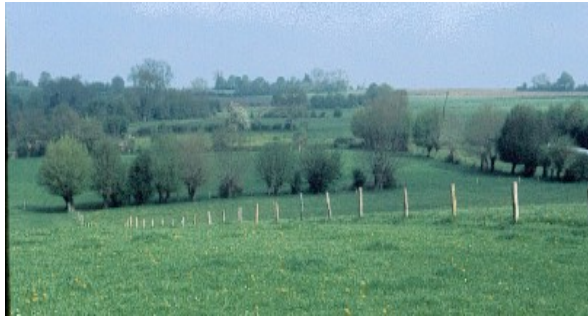
(Bocage brayon près de Senantes)

Cette population a bien été suivie par Sophie PETIT, grâce à une prospection systématique. Ce sont au total 36 mâles chanteurs qui ont été contactés sur les secteurs allant d'Auneuil à Allonne. C'est la fin du secteur bocager du Bray. Malheureusement la déviation de la N31 au sud de Beauvais passe en plein dans ce territoire, annonçant des jours funestes pour l'espèce très impactée par la mortalité routière.