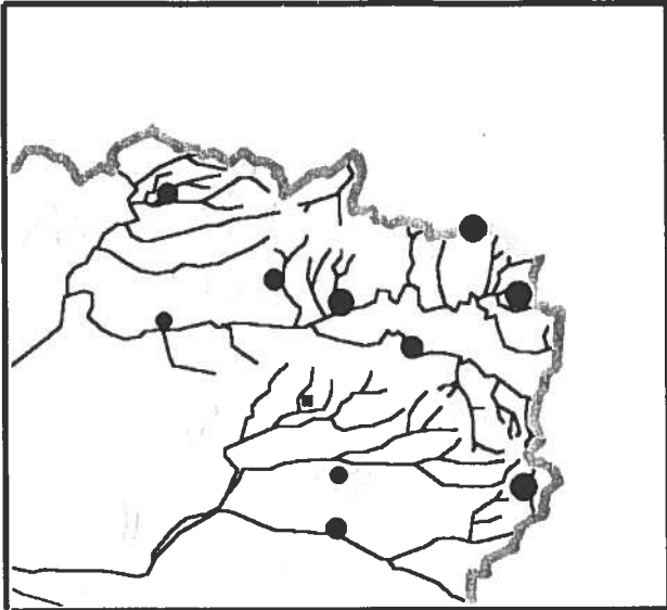
Fig.3 : Localisation des Faucons hobereaux nicheurs