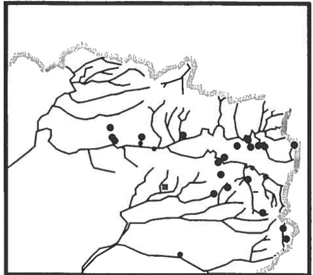
Fig.11 : Localisation des Pies grièches grises

département de l'Aisne** et de plusieurs centaines pour la Picardie(1995) ***.