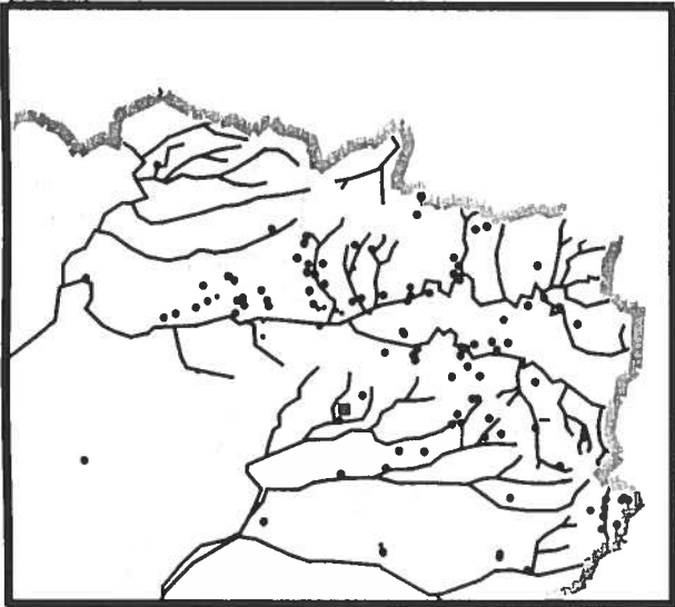
Fig.10 : Localisation des Pies grièches écorcheur nicheuses

Estimations de 200 à 300 couples pour la Thiérache* de 300 à 450 couples pour le département de l'Aisne* autant pour la Picardie (1995) ***.