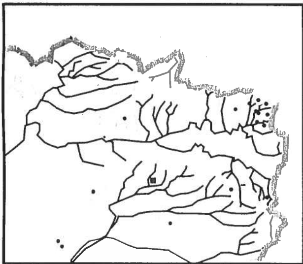
Fig.7 : Localisation des Pics mar nicheurs

Estimation de 50 à 100 couples pour la Thiérache*.