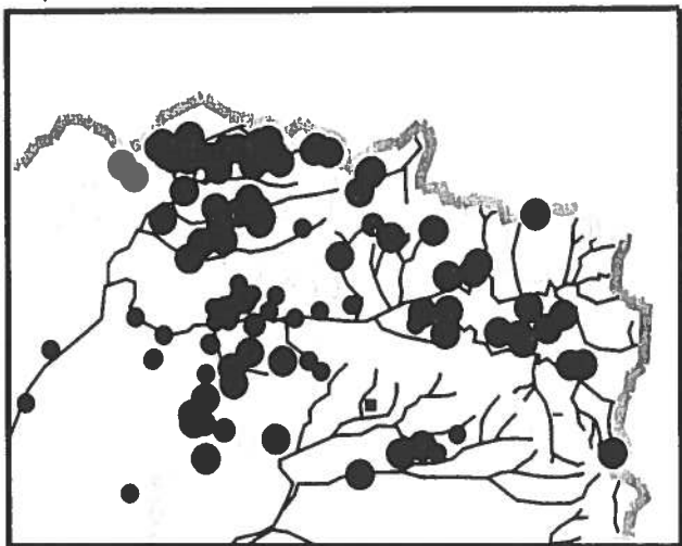
Fig.6 : Localisation des Chouettes chevêches nicheuses

Estimation de 300 à 500 couples* pour le département de l'Aisne.