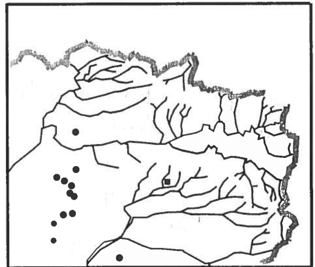
Fig.4 : Localisation des Oedicnèmes criards nicheurs

Estimations de 15 à 30 couples pour la Thiérache*, 30 à 50 couples pour le département de l'Aisne * et 62 à 85 couples pour la Picardie (1995) **.