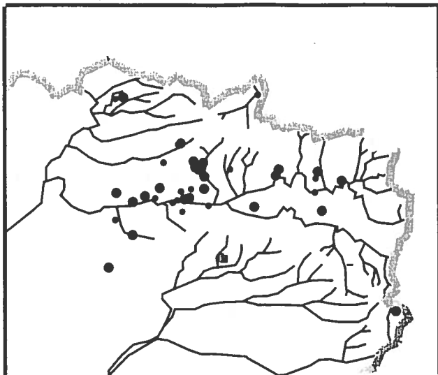
Fig.8 : Localisation des Rouges queues à front blanc nicheurs

Estimation de 200 à 300 couples pour la Thiérache*.