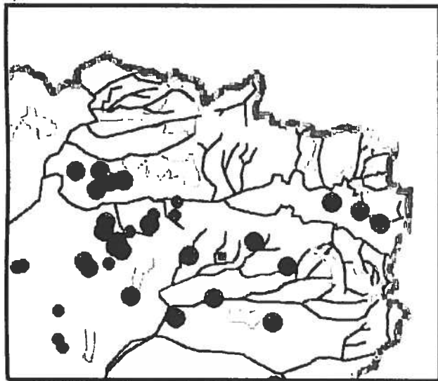
Fig.1 : Localisation des Busards cendrés nicheurs. Thiérache du sud ; il est cependant le signe de la disparition du bocage au sud de la vallée de l'Oise. La Thiérache était plus connue en Picardie pour sa population de Milans royaux que de Busards cendrés... signe des temps.