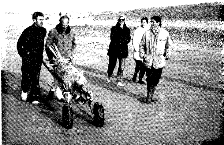
Récupération d'un cadavre sur la plage de La Mollière.

Nous remercions les personnes et organismes cités, pour leur aide et leur participation à ce travail.