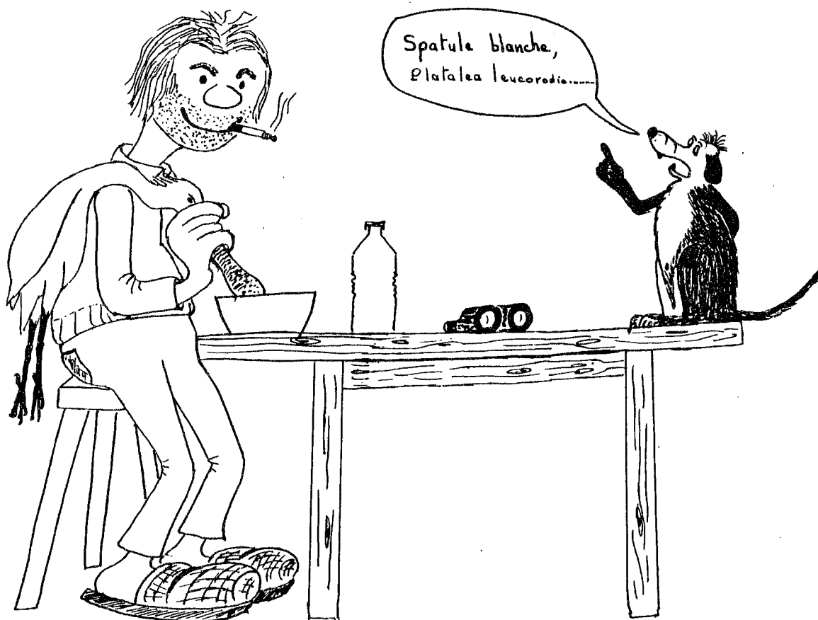
L'auteur et son chien