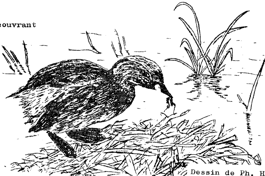
Dessin de Ph. HERTEL

Petit certes, mais très indiscipliné pour ne pas dire teigneux. L'installation en colonie est l'occasion de combats (coups d'ailes, de bec et surtout des poursuites sur l'eau ou en plongée, le tout accompagné de trilles nerveuses et de gerbes d'eau) entre individus ou même entre couples, les quatre oiseaux participant ensemble au pugilat.