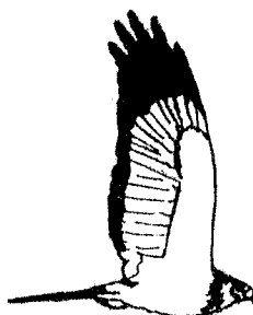
Busard ♂ de l'Aisne