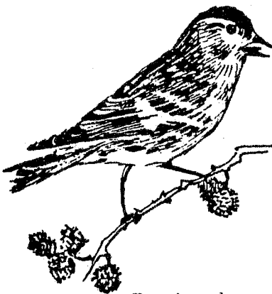
Tarin des aulnes