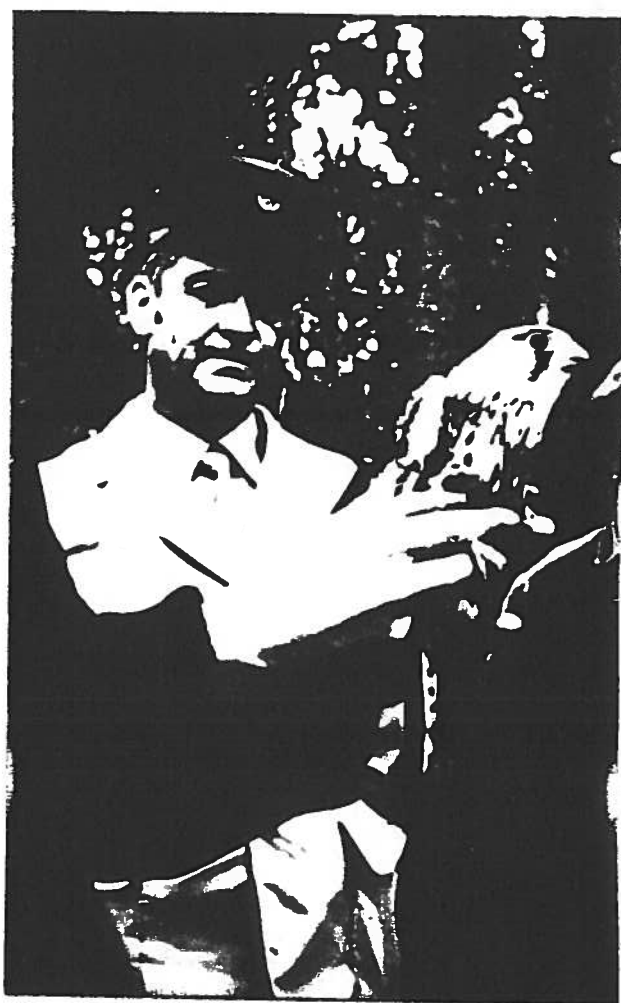
Le Faucon blessé

Le Faucon blessé fut rapidement ramené sur Amiens où la radiographie décéla une fracture du cubitus (nettement visible sur le cliché ci-dessus). Il fut ensuite soigné pendant 9 mois avec d'autres rapaces recueillis blessés par le GEPOP.