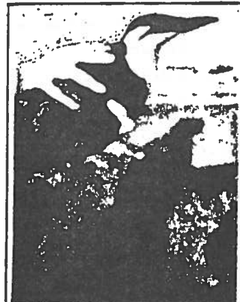
Un oiseau encore vivant récupéré par le G.E.P.O.P., pourra-t-il être sauvé ?

ATTENTION : initialement prévue à la Faculté des Sciences, l'A.G. aura lieu salle Dewailly, place Dewailly à 17h (voir calendrier).