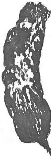
HIBOU DES MARAIS ( Asio flammeus )