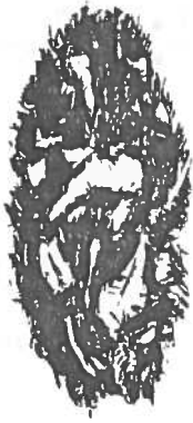
CHOUETTE HULOTTE ( Strix aluco )