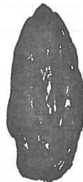
CHOUETTE EFFRAIE ( Tyto alba )