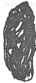
HIBOU MOYEN-DUC ( Asio otus )