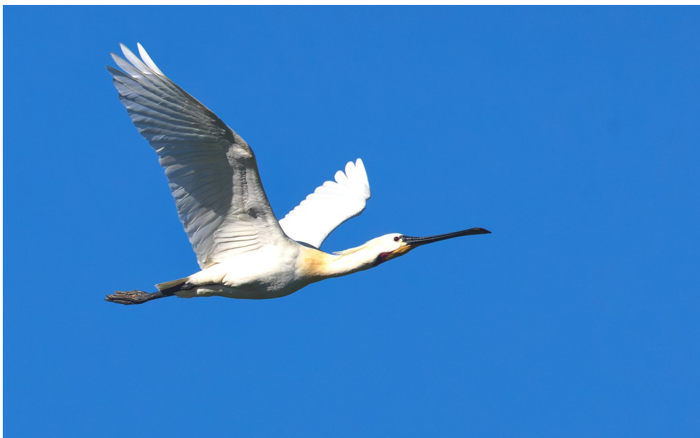
Photo 2 : Spatule blanche Platalea leucorodia .

Au final, on voit que lorsque l'on a la possibilité de suivre un oiseau individuellement régulièrement et sur le long terme que, au-delà des considérations générales sur l'espèce, on a une véritable stratégie comportementale spécifique à chaque individu qui est et doit être à nos yeux uniques.