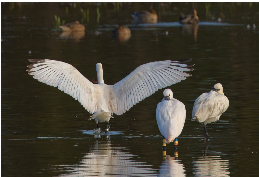
Photo 1 : On peut remarquer les deux types de marquage permettant de reconnaître les oiseaux à distance : un oiseau avec une bague gravée NFLN, un oiseau avec une combinaison de bagues couleur unique.

Code de la bague, date et lieu de baguage, les contrôles visuels antérieurs. Chaque oiseau est désigné dans le texte par le code de sa bague. Le site « parc Ornithologique du Marquenterre » sera simplement appelé : « parc ».