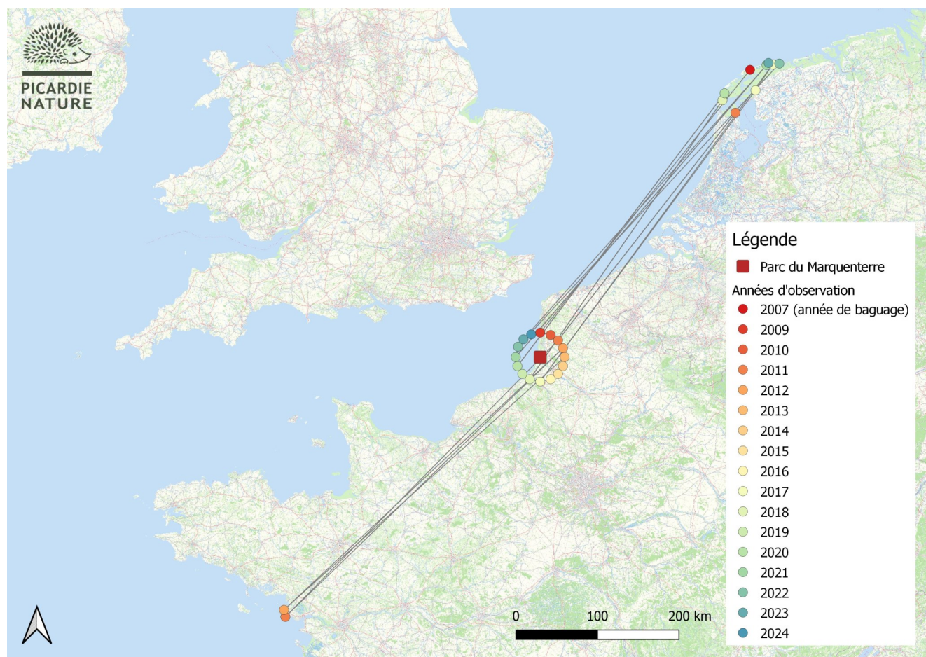
Carte 1 : suivi de l'oiseau AGL/RyfG pendant 17 ans.

En 2024, pas de contact en période de reproduction et l'oiseau est présent au parc du 15 octobre au 07 décembre. Quel suivi remarquable pour cet oiseau pendant ces 17 ans !