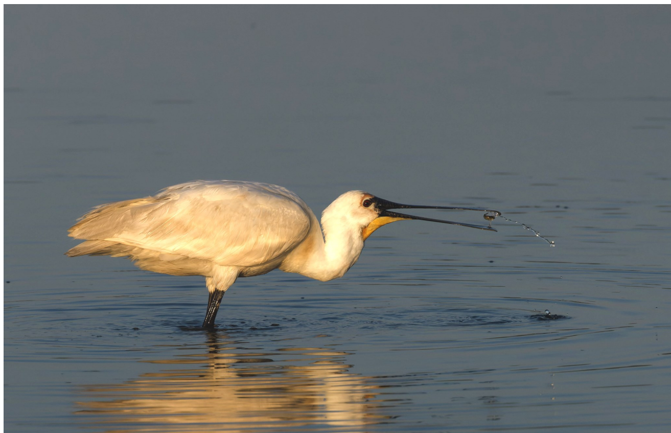
Photo 3 : . Spatule blanche Platalea leucorodia .