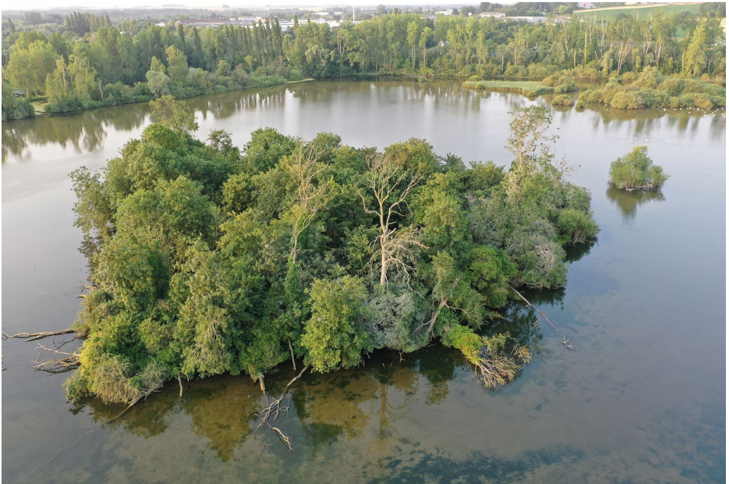
Photo 1 : Au milieu de la Somme, l'îlot boisé du Paté Noyé accueille diverses colonies arboricoles, dont celle des Hérons garde-bœufs.

La progression en Picardie des populations de Hérons garde-bœufs s'est vue confirmée sur la période 2021-2023, au fil des enquêtes et prospections diverses. Les résultats du dénombrement des oiseaux de la mi-janvier 2021 ont, par exemple, révélé une abondance inédite de l'espèce (RIGAUX, 2021).