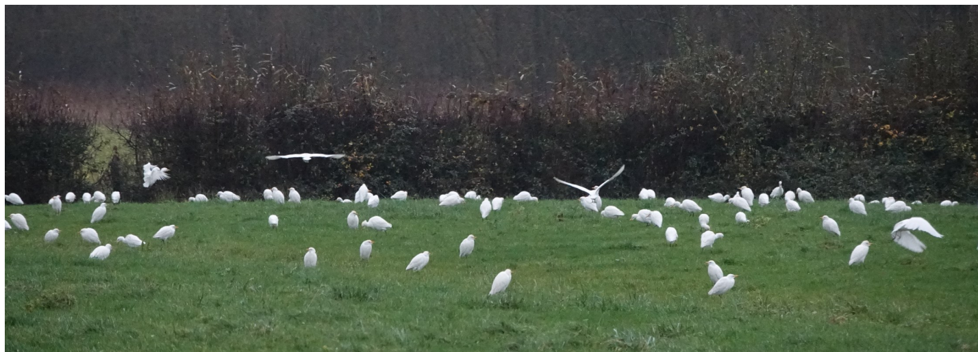
Photo 2 : Les Hérons garde-bœufs se nourrissent souvent dans les prairies.

COMMECY X. (2022). Première reproduction du Héron garde-bœufs Bubulcus ibis en Picardie en dehors du littoral. L'Avocette (46) 1 : 28-30