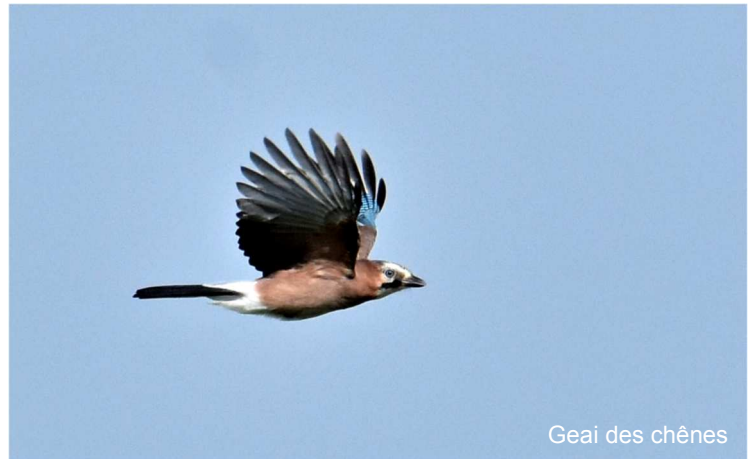
Geai des chênes

Geai des chênes Garulus glandarius (n= 327) ; max. 72 le 28/04.