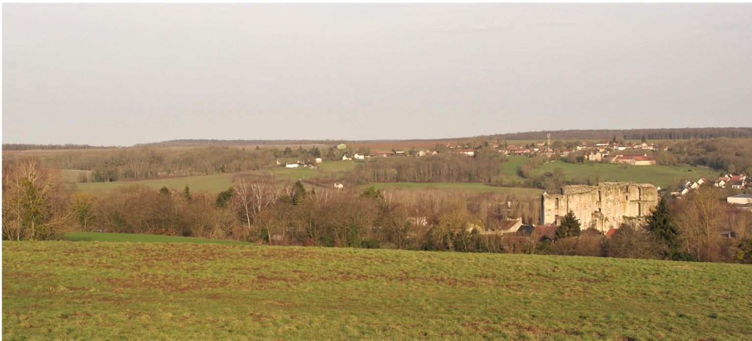
Vue partielle du spot de migration à La Ferté-Milon