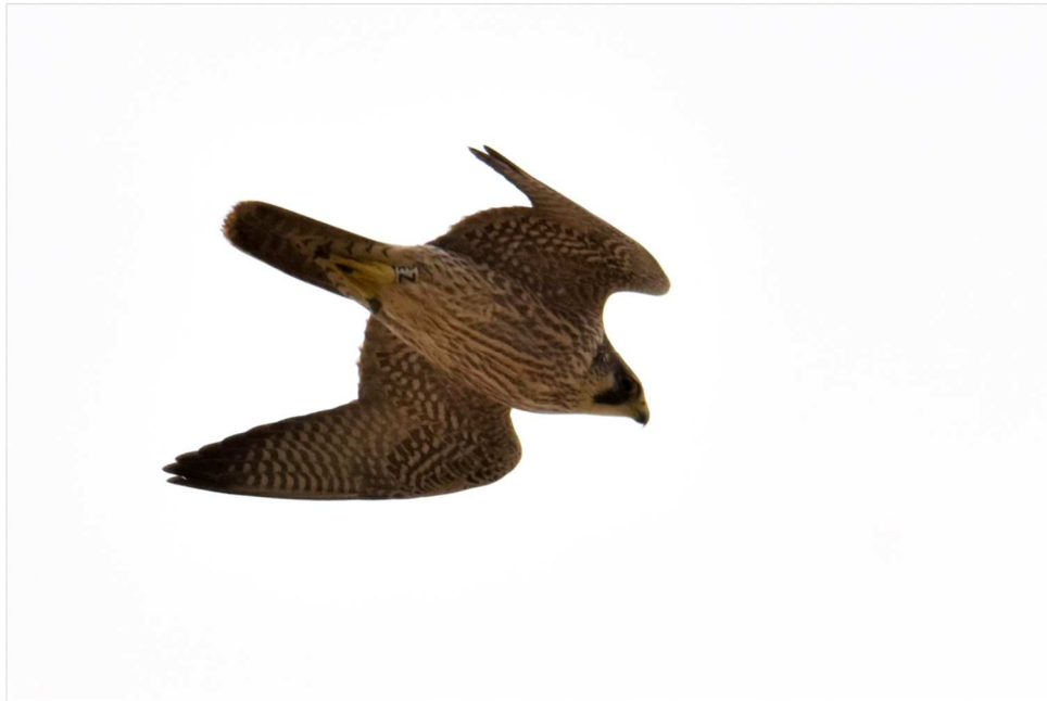
Faucon pèlerin juvénile bagué - 11 mars 2022 - La Ferté-Milon.

Ce jeune mâle est né dans un nid sur un arbre près de Boitzenburg à une soixantaine de kilomètres au nord de Berlin. Il a été bagué le 9 mai 2021. Il est donc à 860 kilomètres de son lieu de naissance. Cet erratisme ou nomadisme des immatures est bien connu. Plus de 70% de cette classe d'âge est trouvée à plus de 100 km de son lieu d'origine. L'ornithologue allemand Silvio HEROLD mentionne dans sa réponse que cette distance importante est toutefois très inhabituelle.