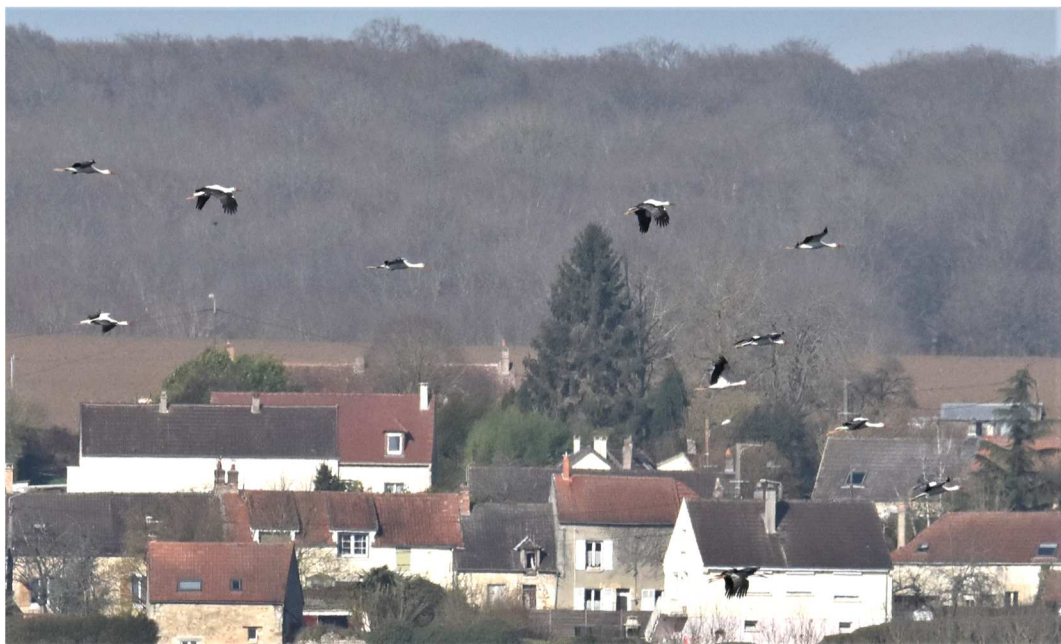
Cigognes blanches en vol battu. La Ferté-Milon - 11 fév. 2022

Ces résultats tiennent compte du double comptage des mêmes groupes d'oiseaux ayant été observé sur les deux sites. Le plus grand nombre d'oiseaux observés chaque jour sur l'un ou l'autre site a été retenu. Ce nombre a été ensuite corrigé en prenant en compte les horaires de passage de chaque groupe, soit un écart-type d'environ 30 minutes +/- 10 entre les deux spots distants de 20 km. On s'aperçoit que le passage s'étale longuement de début février à mi mai. Les migrateurs de mai tardifs sont probablement des oiseaux hivernant en Afrique subsaharienne.