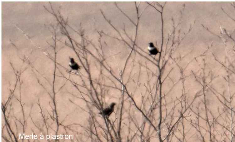
Merle à plastron

Merle à plastron Turdus tirquatus (n=7) ; 1 le 2/04 max. 4 le 11/04, 2 le 12/04.