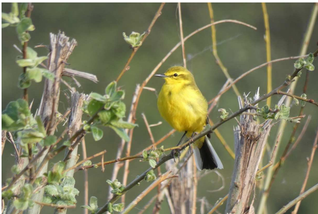
Photo 3 : Bergeronnette printanière flavéole.