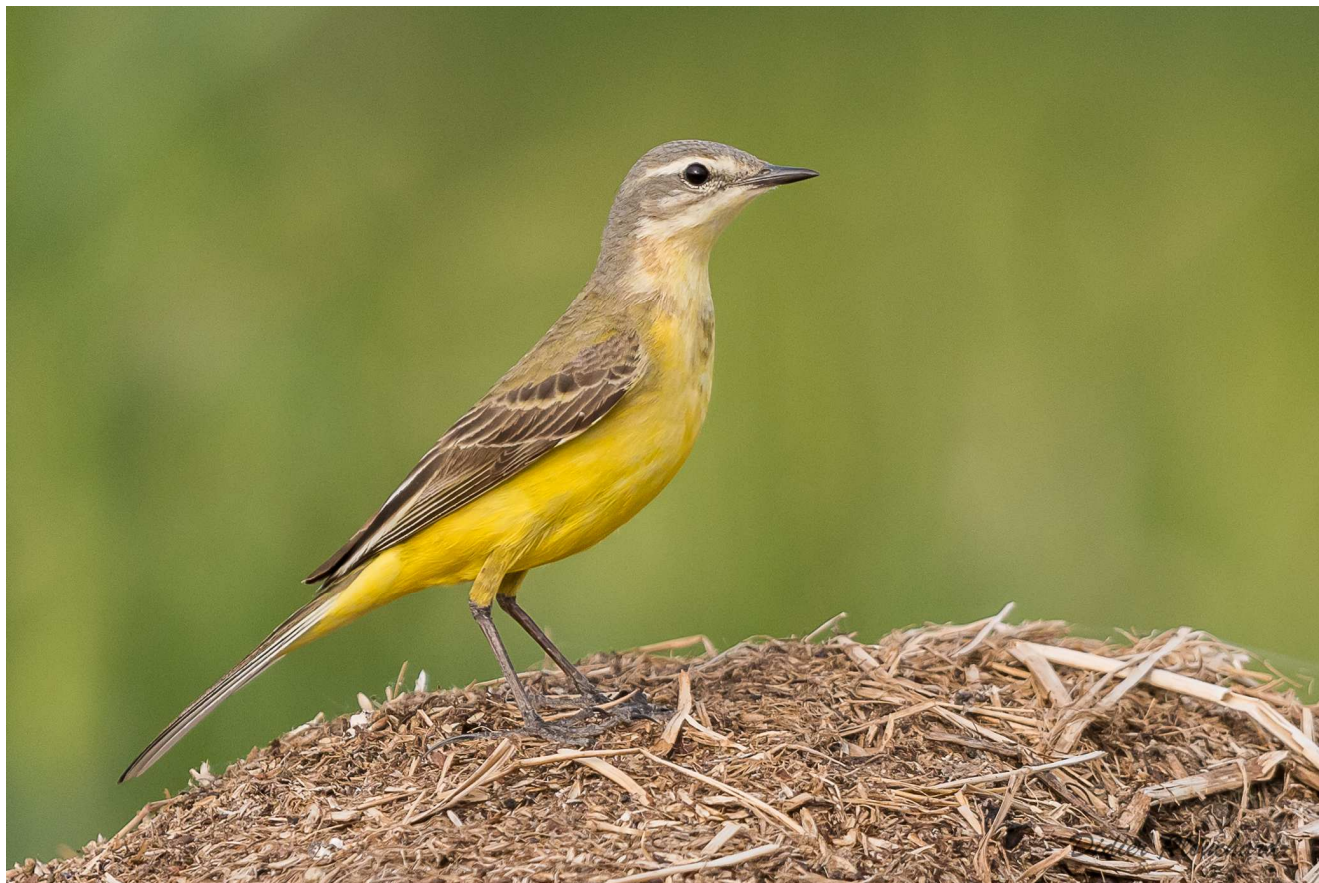
Photo 1 : Bergeronnette printanière le 29 mai 2017.

La Bergeronnette printanière Motacilla flava est une espèce d'oiseau dont de nombreux individus sont bagués en Picardie, surtout dans la Somme, essentiellement lorsqu'elles se réunissent en dortoir pouvant compter plusieurs centaines d'oiseaux en fin d'été. Plus de 4 000 oiseaux ont ainsi été marqués depuis l'an 2000 dont 3 275 par Patrick Decory, 493 par Xavier COMMECY, 250 par Pascal Etienne, 125 par Frédéric BAROTEAUX (et 123 par 7 autres bagueurs en ayant marqué moins de 100 chacun). Malgré ce grand nombre d'oiseaux bagués, il y a très peu de contrôles (oiseau recapturé vivant ultérieurement par un bagueur et dont la bague peut alors être lue) ou de reprise (oiseau trouvé mort) pour cette espèce : moins d'une centaine, souvent des contrôles faits à quelques jours d'intervalle en un même lieu. Ce faible nombre indique que l'essentiel de ces oiseaux bagués sont des migrateurs en halte migratoire vers leurs sites d'hivernage africains.