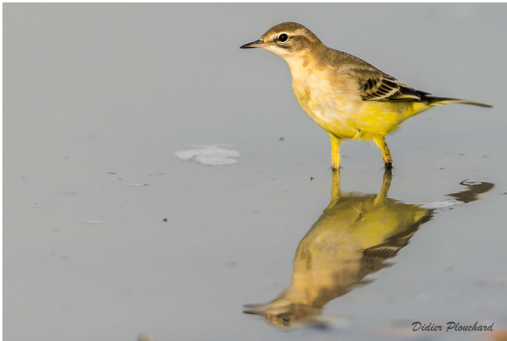
Photo 2 : Bergeronnette printanière femelle à Ault le 30 août 2015.