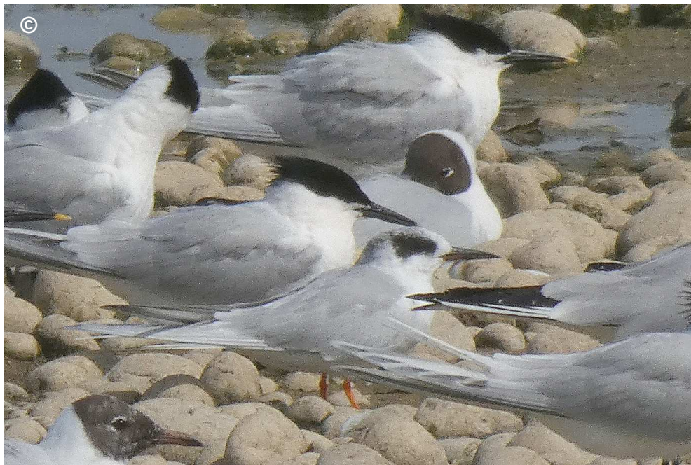
Photo 2 : Bas-champs de Cayeux-sur-mer (Somme - 80). 6 avril 2018.