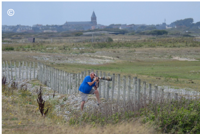
Photo 10 : Un photographe « collé » à la clôture, adoptant un comportement peu respectueux de la quiétude es oiseaux nicheurs.

Peut-être l'installation d'un petit dispositif physique (clôture très basse sur le merlon séparant la piste de la clôture) permettrait-elle de dissuader les visiteurs – ou une fraction plus importante d'entre eux – de s'approcher de cette dernière.