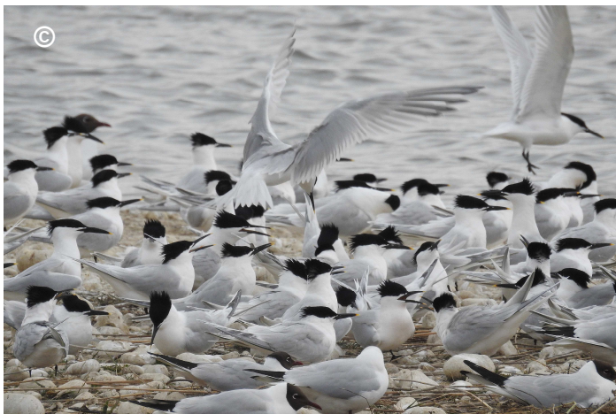
Photo 3 : Installation de la colonie (fin avril 2017) : les oiseaux en position d'incubation ne sont pas encore très nombreux.

Le 23 avril, 250 Sternes caugeks occupent le site, réparties entre deux îlots : 200 sur l'îlot sud, 50 sur l'îlot central.