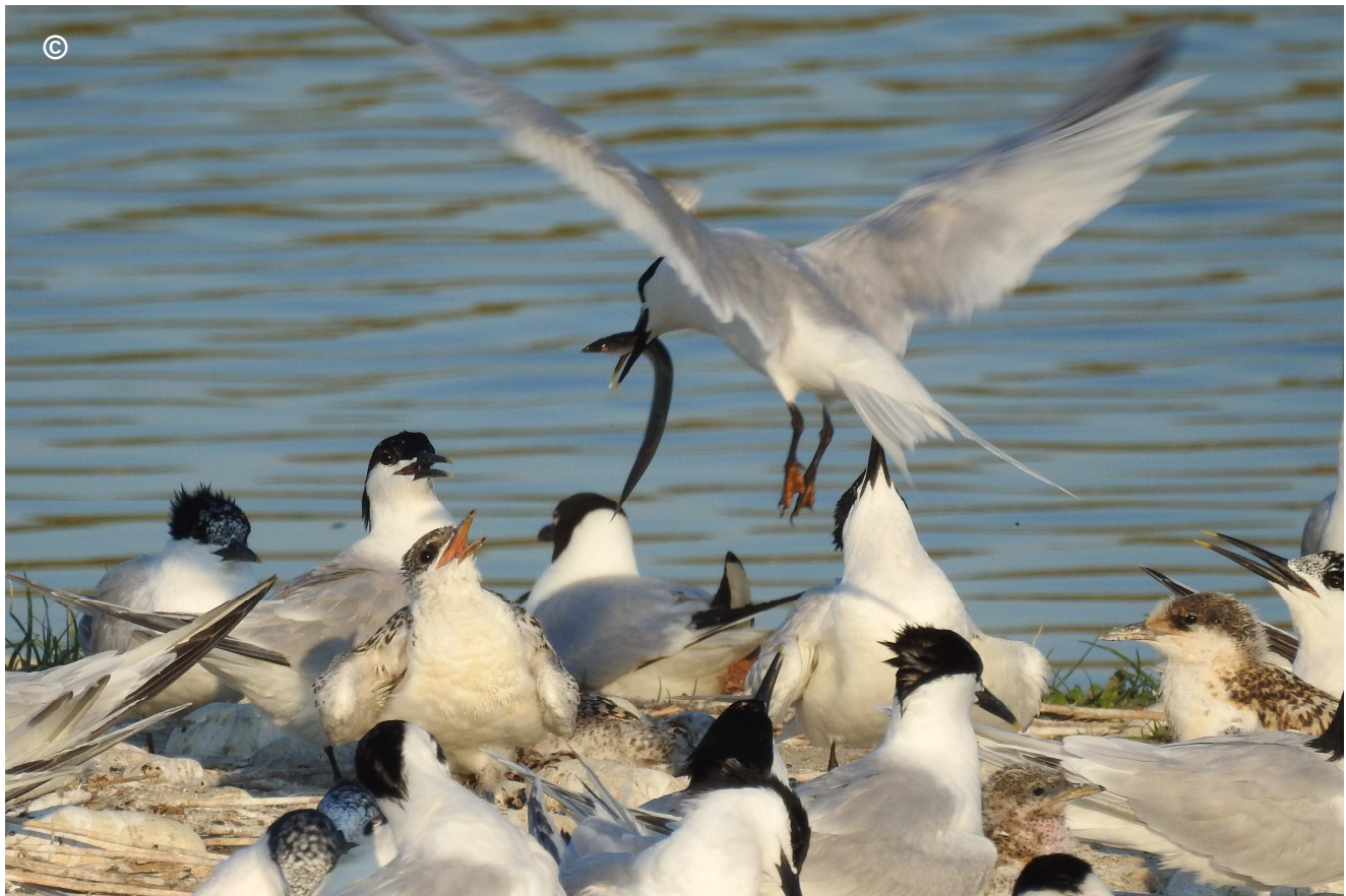
Photo 5 : Apport d'une nourriture à un grand pullus (début juin 2017).

Le 6 mai, 115 nids (et oiseaux en position d'incubation) sont comptabilisés : 90 sur l'îlot sud, 15 sur l'îlot central.