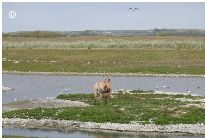
Photo 8 : Intrusion d'un cheval Henson sur un îlot de reproduction : les pénétrations répétées des chevaux au sein des îlots ont perturbé la saison de reproduction 2017.

y sont dénombrés le 14 mai, dont 185 sur l'îlot méridional. Au moins deux couples de Mouettes mélanocéphales Larus melanocephalus nichaient également, dont un sur ce dernier îlot, également choisi par quelques couples d'Avocette pour y installer leurs nids. Cette forte présence des Mouettes rieuses a pu restreindre l'espace disponible pour les Sternes caugeks mais ces Mouettes ont également pris en chasse des prédateurs potentiels (Goélands) de façon plus déterminée ou efficace que les caugeks, épaulées parfois dans leurs poursuites défensives par des Tadornes de Belon Tadorna tadorna .