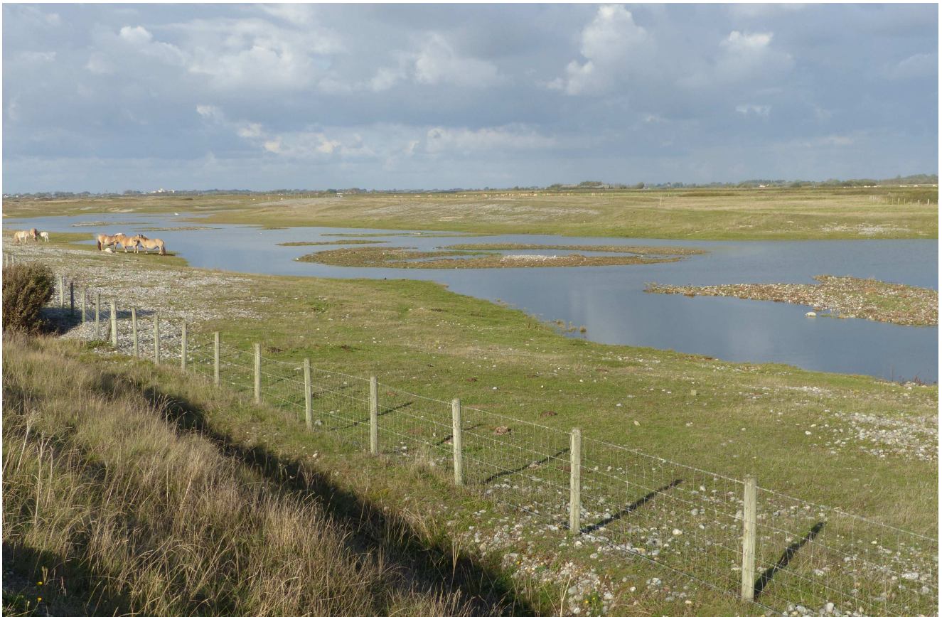
Photo 1 : Présentation du site de reproduction utilisé par la Sterne caugek lors des étés 2016 et 2017. On repère, à droite, la partie nord de l'îlot méridional et, au centre, l'îlot central.