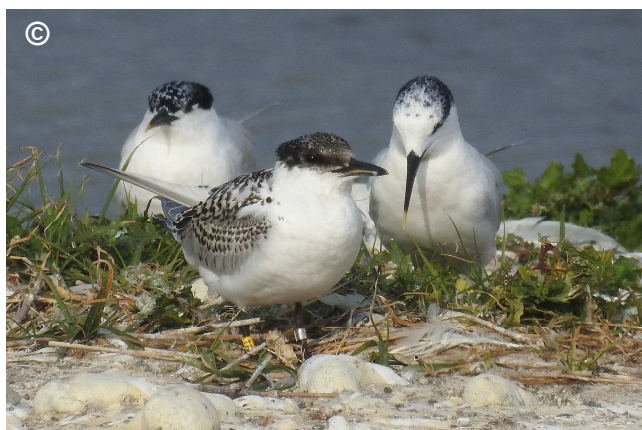
Photo9 : Un juvénile visiteur issu d'une colonie de reproduction étrangère où il a été bagué (mi-juillet 2017)

Le parcours de quelques oiseaux mérite d'être mentionné :