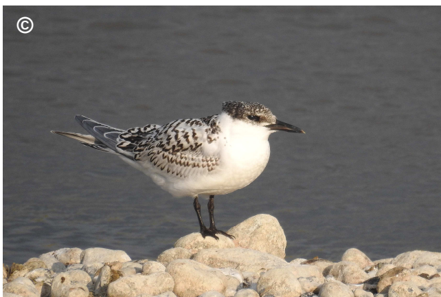
Photo 7 : Un juvénile vraisemblablement né sur place (mi juillet 2017)