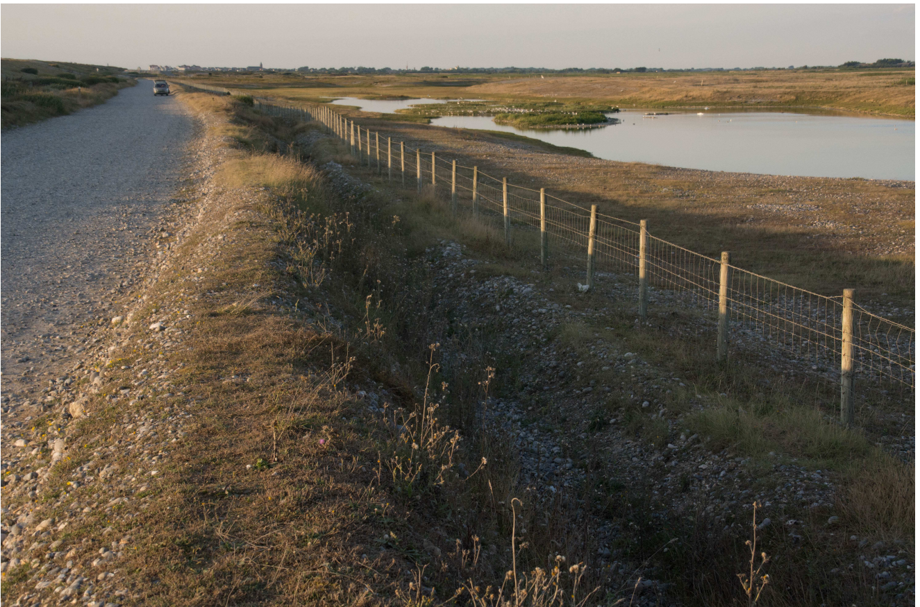
Photo 2 : Présentation du site de reproduction utilisé par la Sterne caugek en 2016 et 2017. On voit la proximité de la piste.