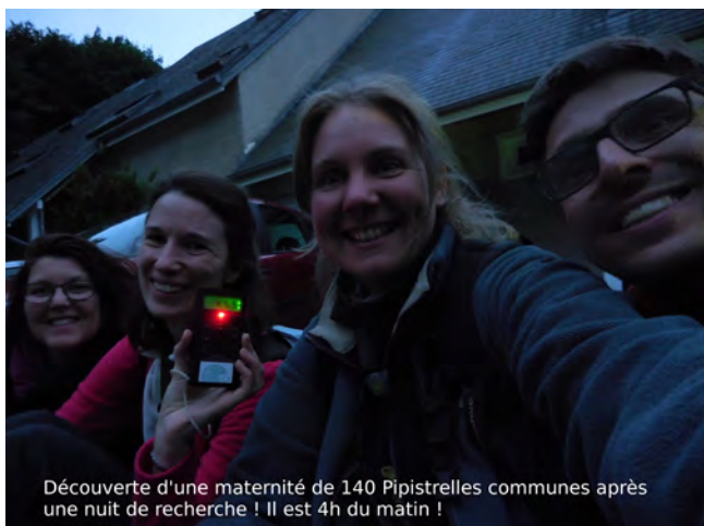
Découverte d'une maternité de 140 Pipistrelles communes après une nuit de recherche ! Il est 4h du matin !