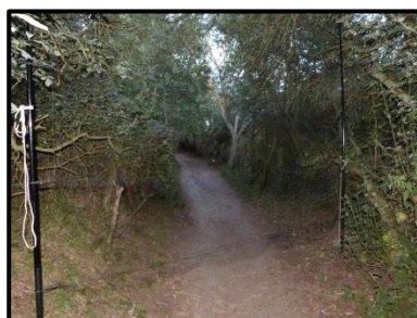
Figure 7: Filet au sol placé dans le lieu de passage supposé des chauves-souris

En 2013, Thomas Cheyrezy (Formateur à la pratique de la capture), Lucie Dutour (Animatrice de la déclinaison régionale du plan d'action) et Gratien Testud (Coordinateur régional) ont lancé la formation à la pratique de la capture en Picardie. Le 22 août 2013, une session de capture a été intégrée à cette formation régionale. En aucun cas une séance de capture de chauves-souris ne doit être un outil à la pédagogie. Au parc du Marquenterre, la capture se révélait essentielle afin de connaître les états sexuels des individus : indications quant à la présence éventuelle d'une colonie à proximité ou au sein du Parc. En présence de Philippe Carruette (Responsable pédagogique) et Grégory Rollion (Garde de la Réserve Naturelle), six filets ont été posés et trois espèces ont été capturées puis identifiées : 12 Pipistrelles communes, une Pipistrelle de Nathusius et un Murin à oreilles échancrées, soit un total de 14 individus. La présence de P.Carquette, bagueur du Muséum National d'Histoire Naturelle a également permis de baguer une jeune femelle d'Epervier et un Merle noir en début de soirée.