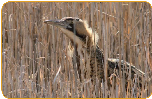
Butor étoilé