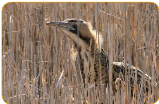
Butor étoilé