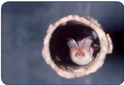
Oreillard roux

En 2012, Picardie Nature décline le label national «Refuge pour les Chauves-souris». Il permet de mettre en avant les actions des particuliers et des collectivités pour les chauves-souris. Picardie Nature réalise un diagnostic et apporte conseils adéquats. Aux 4 refuges picards en 2012, s'ajoutent déjà 21 refuges cette année, et d'autres sont à venir.