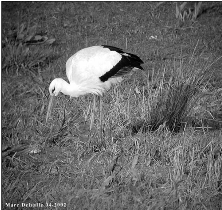
Cigogne blanche