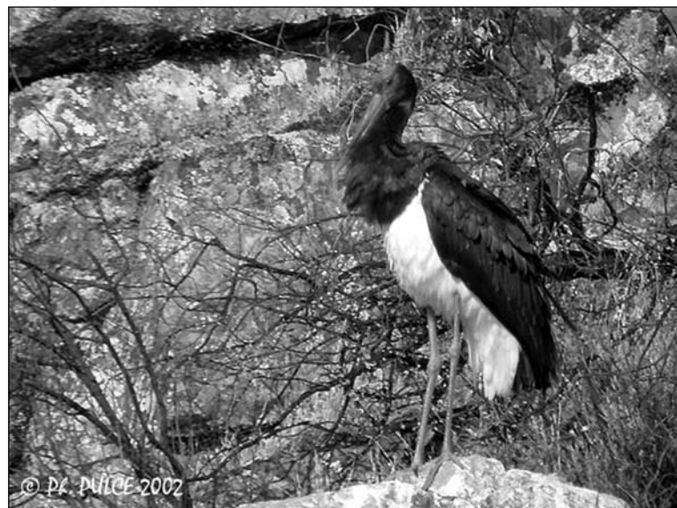
Cigogne noire