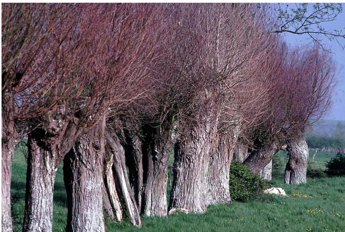
... et du maintien dans le paysage pastoral d'arbres présentant des sites de nidification, tels que les vieux saules têtards.