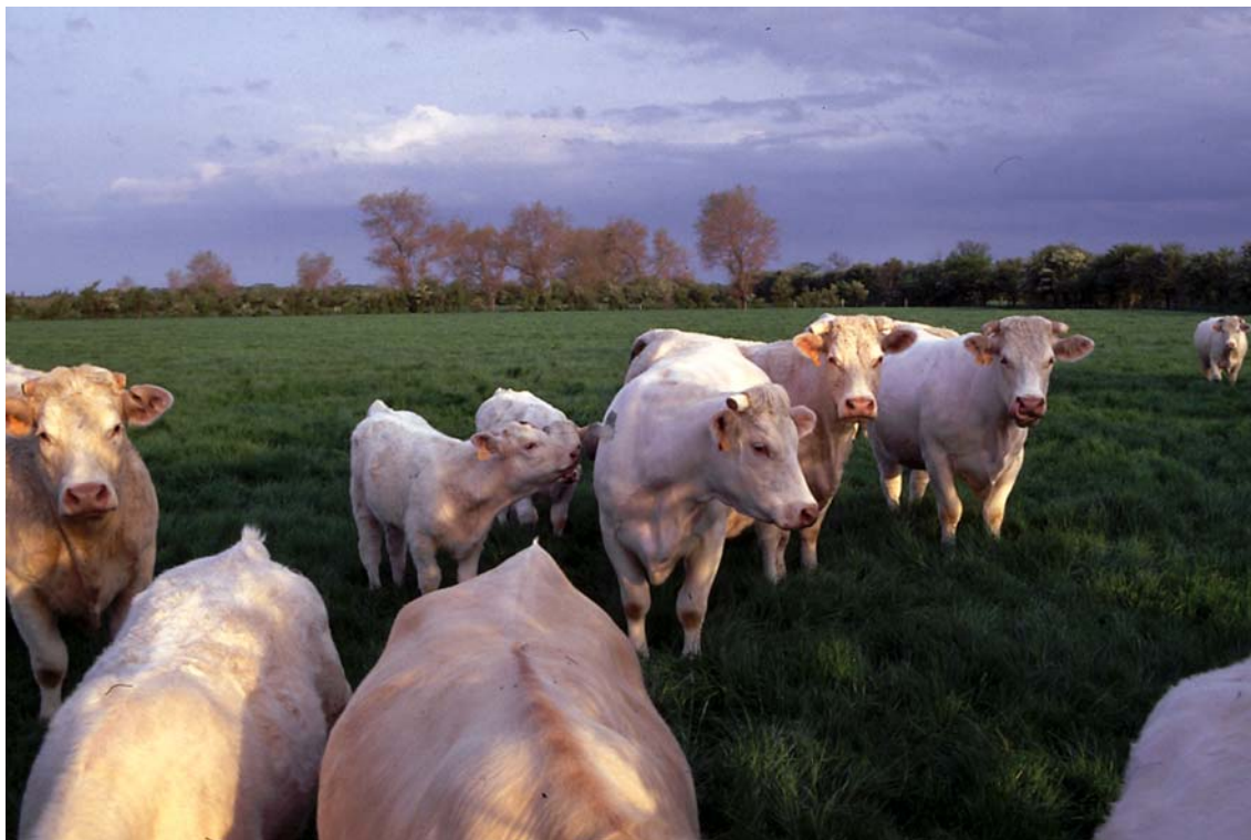
Le maintien de la Chouette chevêche au sein de la plaine maritime est étroitement dépendant de celui d'un élevage fondé sur l'exploitation de prairies permanentes...