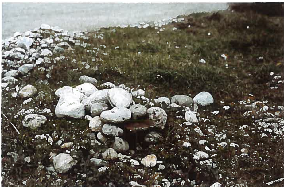
Ponte de Traquet motteux Oenanthe oenanthe en nichoir au Hâble d'Ault en juin 1996