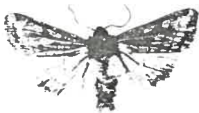
à gauche Mamestra splendens, grandeur nature