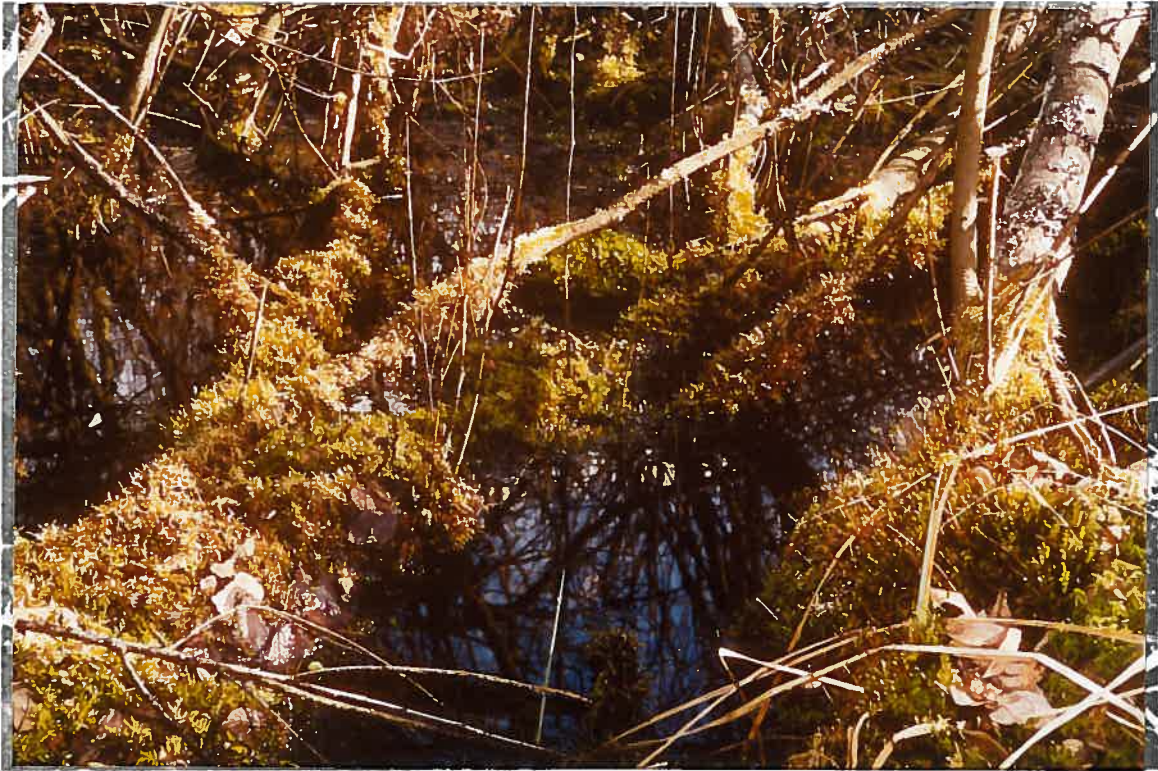
biotope amphibie, saulée à sphaignes et autres mousses