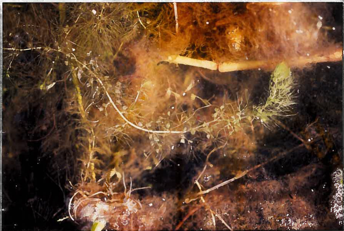
en haut à droite à gauche