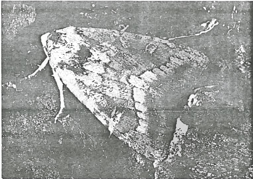
en haut adulte grossi de Mamestra splendens