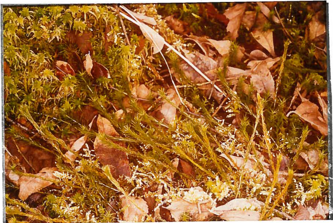
Polytricum commune (au centre et à droite) parmi les sphaignes (surtout en haut à gauche)