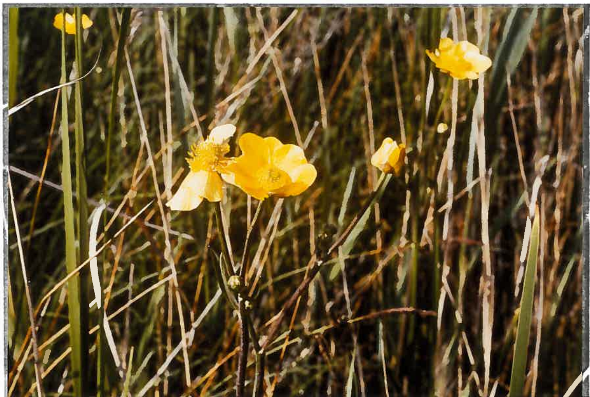
La Grande Douve (Ranunculus lingua). C'est une plante figurant dans la liste des plantes protégées.

Usnea subfloridana (touffe au centre) avec Parmelia physodes L'Usnée indique un biotope dont l'air est pur.