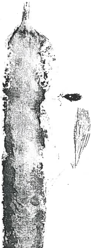
Dessin Marc Sengez

Remerciements spéciaux aux Internautes qui ont répondu à notre demande : D. Cohez, E. Buchel