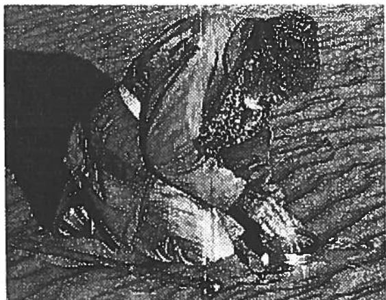
Le «blason» de Théodore Monod