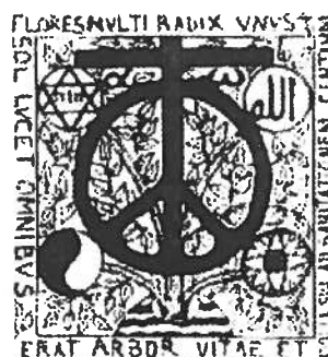
Le «blason» de Théodore Monod