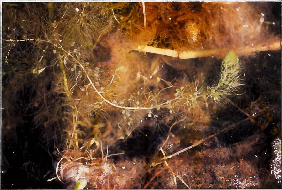
en haut à droite à gauche