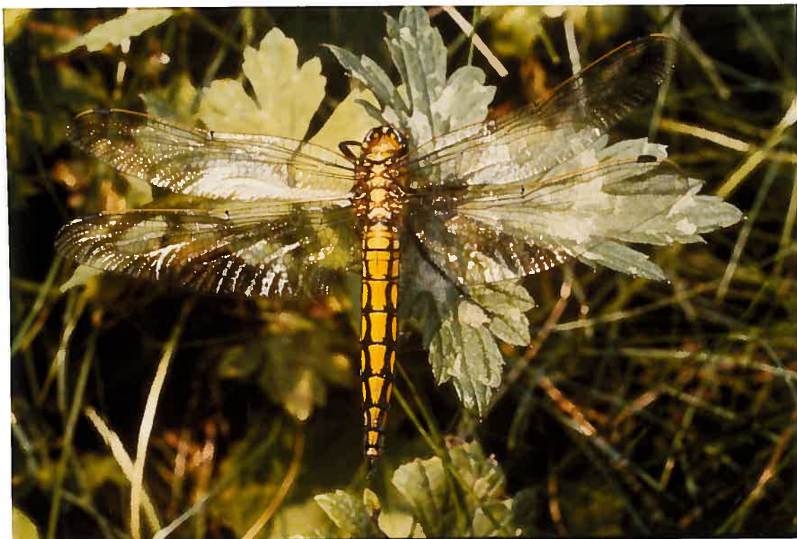
en haut: Orthetrum cancellé , femelle.