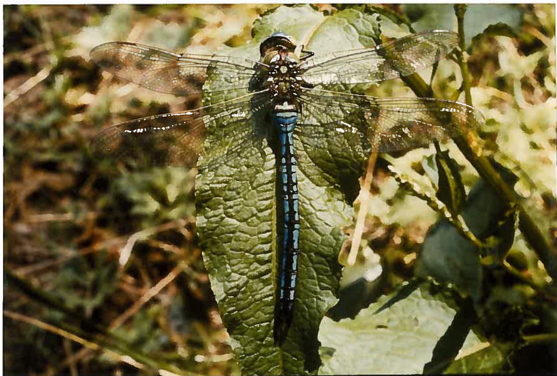
en bas: Anax empereur , mâle.