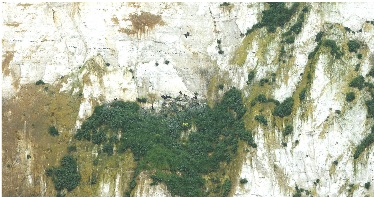
photo 1 : Grands cormorans nicheurs. Falaises de Mers-nord. Mi-mai 2023.

Xavier COMMECY 4 place Godailler Decaix 80800 Gentelles xavier.commeci@wanadoo.fr