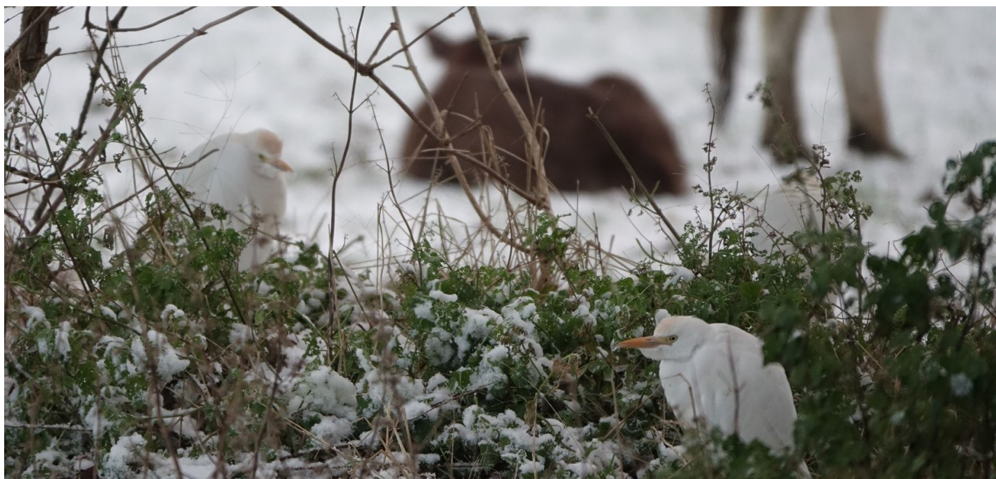
Photo 2 : Hérons garde-bœufs transis par le froid et la neige le 12 décembre 2022 à Woignarue.

dortoirs à la mi-décembre, un mouvement de fuite. À ce dernier s'est ajoutée une mortalité qu'il n'a pas été possible de mesurer précisément mais qui a été bel et bien constatée : Mr DUPUIS, comm. pers., relate l'observation de plusieurs cadavres au pied du dortoir de Gouy sur la commune de Cahon. Le froid s'étant prolongé jusqu'au 18 décembre avant un fort redoux, des départs et/ou une mortalité supplémentaires sont intervenues après le comptage de décembre, ce qui se traduit dans l'effectif de janvier, presque exactement deux fois plus faible que celui de décembre.