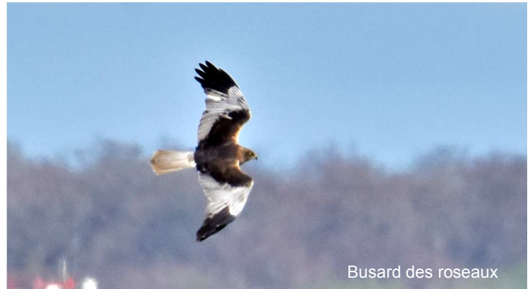
Busard des roseaux

Busard des roseaux Circus aeruginosus (n=40) ; max. 21 le 9/04.