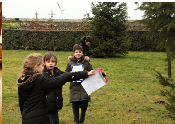
Intervention sur le site de l'AME pour les élèves de Mers-les-Bains, conseil des enfants pour les élèves de l'ATE du RPI du Mont Faÿ et état des lieux de la biodiversité pour les élèves de l'ATE de Maignelay-Montigny