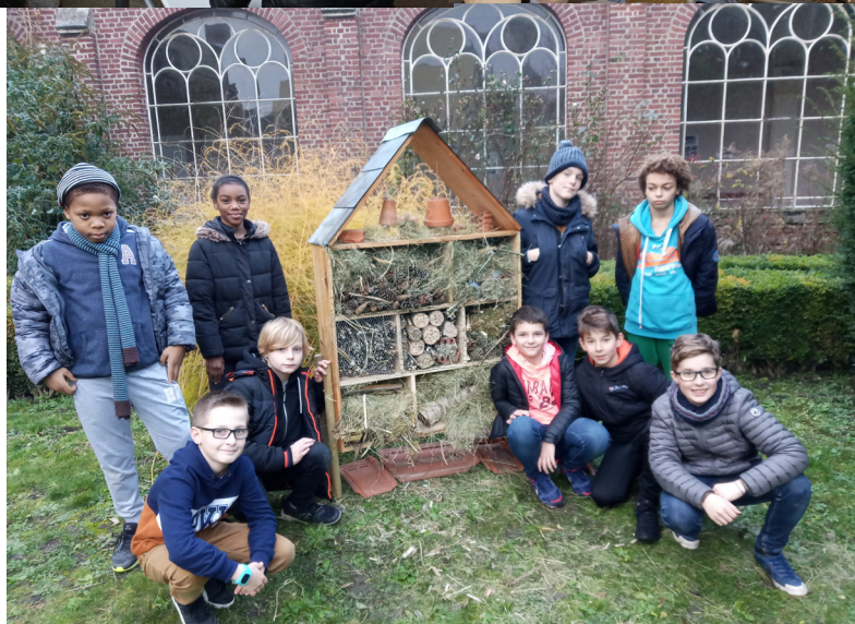
Découverte et accueil des insectes au sein du Lycée Sainte Famille, à Amiens