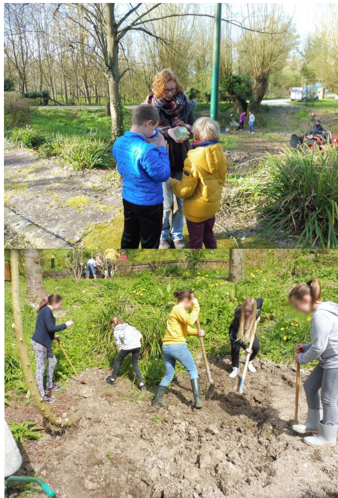
Etat des lieux de la biodiversité et participation au chantier pour les élèves de l'école de Contay

Les enfants de l'école de Contay et du club CPN des Copains de la Nature ont eu l'occasion de participer à l'un de ces chantiers participatifs, celui de Vadencourt (80), soient 62 jeunes. La mare communale à sec depuis de nombreuses années a pu reprendre une vie foisonnante ! Tritons ponctués et palmés, têtards de différents âges, Gerris, Cresson et autres espèces animales et végétales ont ainsi déjà réinvesti les lieux.