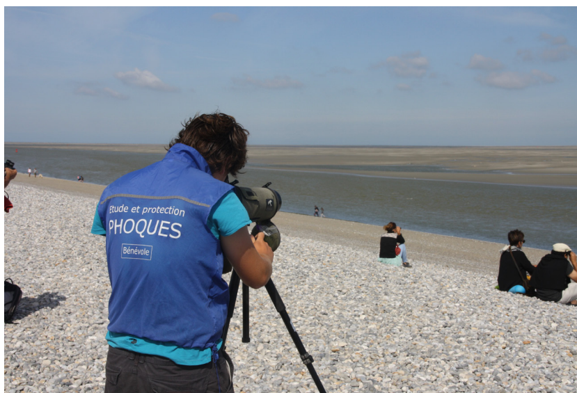
Figure 6 : Un bon moyen de reconnaissance des bénévoles sur le terrain durant la surveillance estivale : les gilets bleus.

Ce volet est l'objectif même de la « surveillance estivale ». En effet, il va permettre de garantir une zone de tranquillité. Cette tranquillité relative permettra ainsi le bon déroulement du cycle biologique des deux espèces, et surtout de la reproduction du Phoque veau-marin.