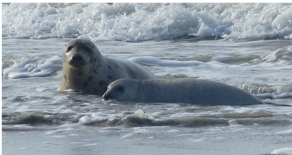
Figure 3 : Fauvette et son blanchon le 08/01/2019

Concernant le Phoque gris, 2 blanchons ont été découverts durant l'hiver 2018/2019 . C'est la première fois que 2 naissances sont recensées et suivies jusqu'au sevrage durant la même saison. Il s'agit de deux mâles nés le 28/12/2018 et le 18/01/2019. Vanesse, femelle connue comme mettant bas en baie de Somme depuis 2014, a été la deuxième à mettre bas. Pour la première, il s'agit de Fauvette, identifiée par l'association ADN, et sûrement une primipare.