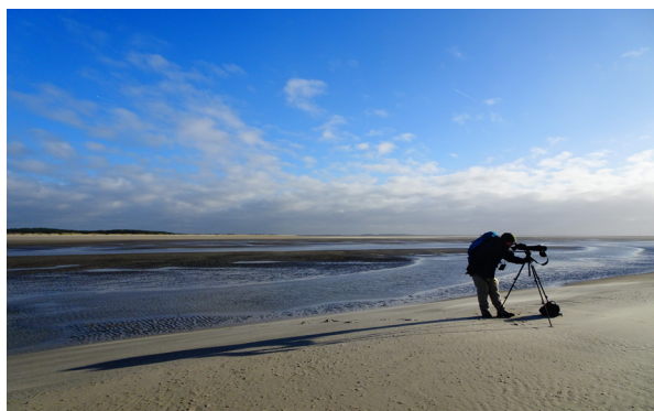
Figure 7 : Suivi hivernal du 14/01/2019 permettant le suivi du couple mère-blanchon.

En terme d'organisation, la surveillance hivernale débute dès le signalement ou la découverte d'un blanchon et se termine lorsqu'il n'est plus observé. Les bénévoles se relaient ainsi quotidiennement, faisant abstraction de la météo et des fêtes de fin d'année. Les sessions de terrain sont également longues, du fait du temps de trajet conséquent pour arriver au site de suivi.