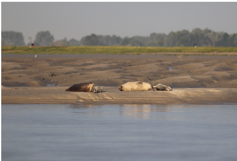
Figure : 2 : Exemples de couples mères-petits observés au cours de l'été 2019 sur le reposoir « R5 » (photo de Benoît Mallet, prise le 06/07/2019).

Au total, 142 jeunes Phoques veaux-marins ont vu le jour cet été (139 en 2018) . En dehors de la découverte de deux prématurés morts retrouvés le 09/04 et le 06/06, les premières naissances ont été recensées à partir du 12/06 pour. Comme chaque année la période la plus chargée pour les naissances est la première quinzaine de juillet (figure 2).