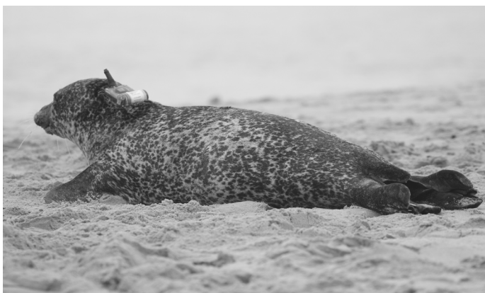
Figure 5 : Exemple d'un individu balisé lors de la deuxième phase : un phoque veau-marin équipé le 05/10/2019 (photo de Julie Mestre).

Lors de ces deux sessions, l'association et les bénévoles du réseau ont pu partager leur connaissance du site et du comportement des animaux afin de mener à bien cette mission dans un temps record. Chacun a ainsi pu contribuer au bon déroulé de l'opération : du repérage maritime en amont, aux captures à proprement parler, en passant par le pilotage des embarcations et de l'aide technique lors des manipulations.